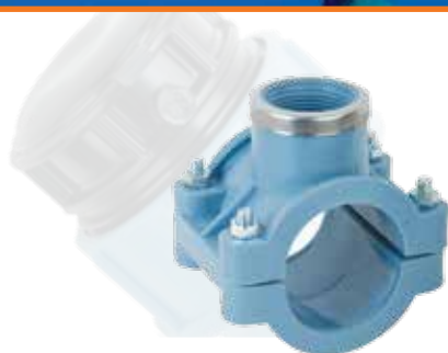
Obejma „siodło” 4 śruby