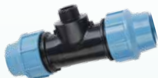
Trójnik z odejściem - gwint zewnętrzny