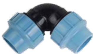
Kolano zaciskowe 90°