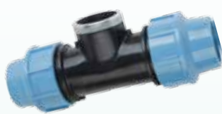
Trójnik z odejściem - gwint wewnętrzny