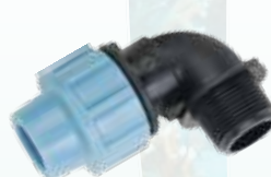
Kolano 90° z gwintem zewnętrznym