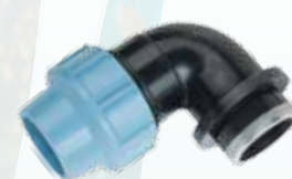
Kolano 90° z gwintem wewnętrznym